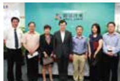
时任上海市杨浦区区长诸葛宇杰一行来访

2019年12月19日,上海市委常委、副市长吴清、市经济信息化委总工程师刘平等一行莅临微谱。