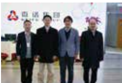
上海市委常委、副市长吴清一行莅临微谱

2019年12月19日,上海市委常委、副市长吴清、市经济信息化委总工程师刘平等一行莅临微谱。